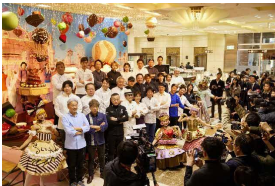
2024 シーズン オープニングセレモニー