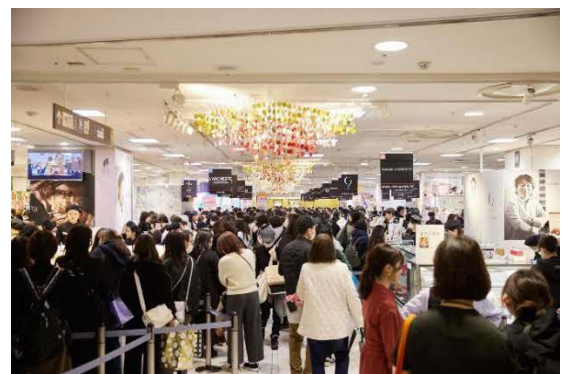
2024 シーズン 会場内の様子