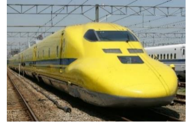
（ドクターイエロー）

新幹線電気軌道総合試験車923形（通称「ドクターイエロー」）のうち、JR東海所属の編成（以下「T4編成」）は、2025年1月に検測走行を終了する予定です。これに合わせ、T4編成の体験乗車やおそうじイベント、また特別なコラボグッズが当たるキャンペーン企画などを行います。