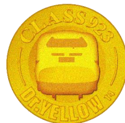
ワッペンデザイン