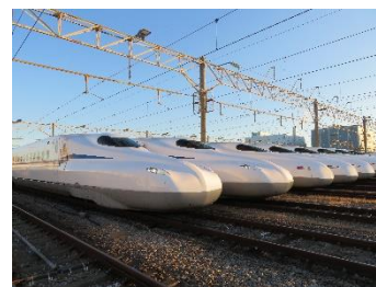
(車両基地内での撮影イメージ)

車両基地内で新幹線が並ぶ姿を写真におさめよう。 ※線路内に立ち入ることはできません。 ※当日の運行状況によって、滞泊している車両が見られない場合がございます。