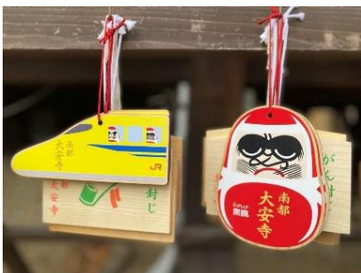
(大安寺 コラボ絵馬/奈良)