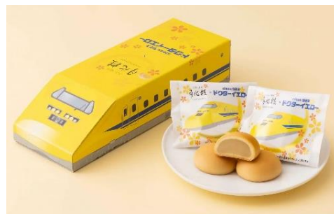
(月化粧 コラボパッケージ/大阪)