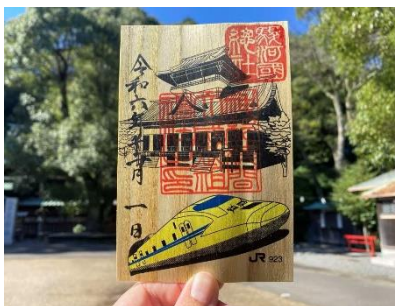
(静岡浅間神社 コラボ御朱印/静岡)