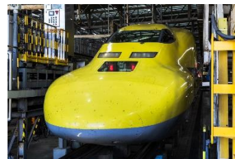
(ドクターイエロー)

これまで「新幹線のお医者さん」として活躍してきたドクターイエロー（T4編成）をみんなできれいにしよう。 ※車体側面をきれいにする体験をしていただきます。