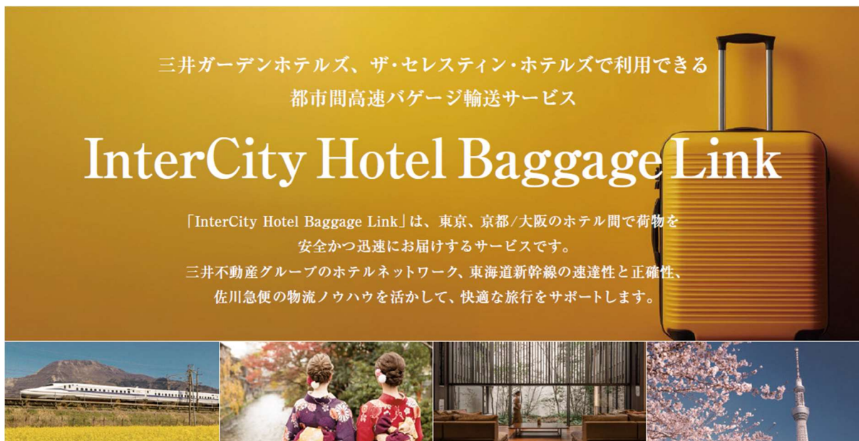
「InterCity Hotel Baggage Link」メインビジュアル

三井不動産グループでは、東海道新幹線を活用した今回の新サービスを始めとして、ホテル宿泊ゲストの荷物輸送をサポートすると同時に、旅行者の大型荷物持ち込みによる公共交通機関の混雑を緩和することで、訪日外国人旅行者の増加に伴うオーバーツーリズムの問題解決にも取り組んでまいります。