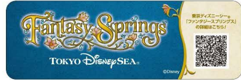
テーブルシールデザイン (グリーン車と7号車を除く)