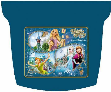
ヘッドカバーデザイン (グリーン車と7号車を除く)