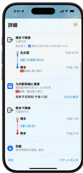
「チケットを入手」を選択