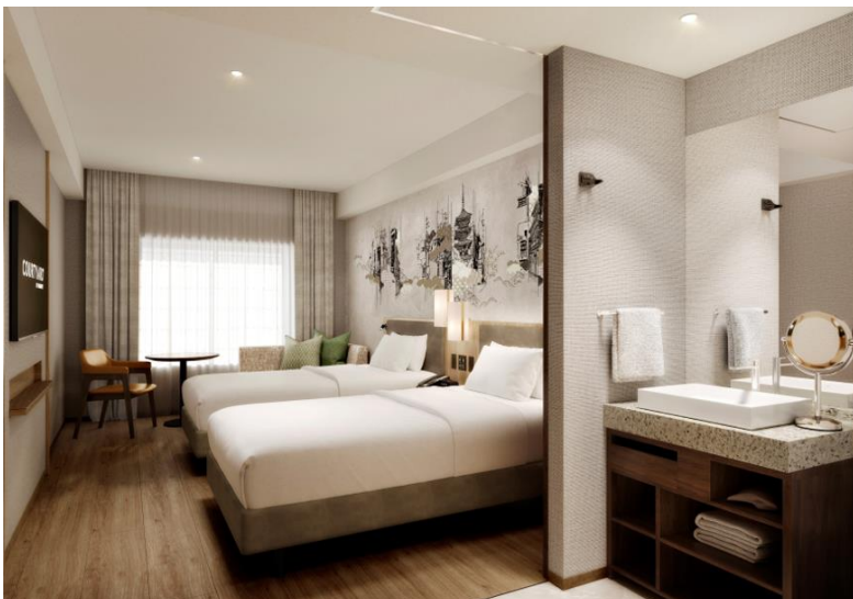
ゲストルーム（ツイン 29㎡）

本ホテルの客室は『現代と過去の京都の町並みの融合』をテーマに、伝統的な美しさと現代的な快適さが調和し、京都ならではの心のこもったぬくもりを感じる空間を提供します。この空間で京都を訪れたゲストをお迎えし、ゆったりとした時間と快適な体験を通じて、京都での滞在をより満足いただけるおもてなしを提供します。インテリアデザイナーは、世界のラグジュアリーホテルなどで豊富なデザイン実績を持つハーシュ・ベドナー・アソシエイツを起用しました。