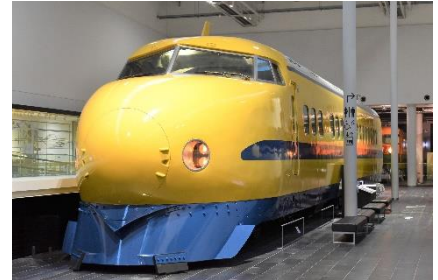
ドクターイエロー（T3編成）

・ 当日はドクターイエロー（T3編成）の車内に入ることはできません。車内の最終公開は2025年5月26日(月)を予定しています。詳細は別紙1をご参照ください。