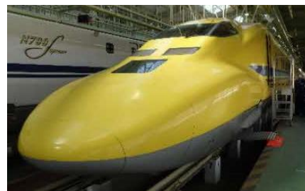
ドクターイエロー（T4編成）

リニア・鉄道館 1階 車両展示エリア ドクターイエロー（T4編成）付近 ※現地に集合いただきます。