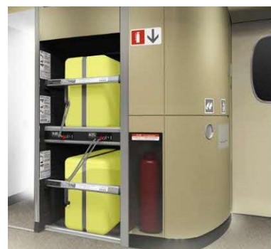
デッキ部の荷物置場 （現「特大荷物コーナー」）

※お客様同士でゆずりあって、ご利用ください。空きスペースがない場合は、従来どおり、荷物棚等をご利用ください。