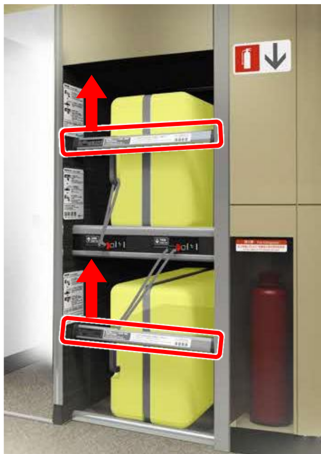
デッキ部の荷物置場 (現「特大荷物コーナー」)

荷物の転落を防止するためのバーが設置されています。 そのまま持ち上げて荷物を収納してください。