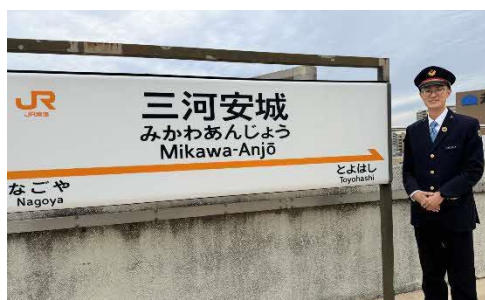
J R東海の現役駅員の音声を収録