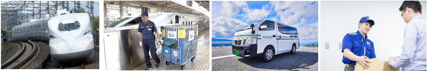
▲N Xスーパーエクスプレスクーゴ輸送サービスの提供イメージ

今後も日本通運とＪＲ東海は、お客様の多様なニーズにお応えできるよう、努めてまいります。