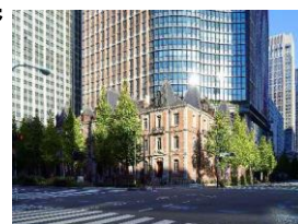
三菱一号館美術館

（EX旅先予約「『トワイライト、新版画—小林清親から川瀬巴水まで』三菱一号館美術館 入館券」をご購入ください。）