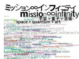
東京都現代美術館

（EX旅先予約「東京都現代美術館 企画展「ミッション∞インフィニティ」観覧チケット」等をご購入ください。）