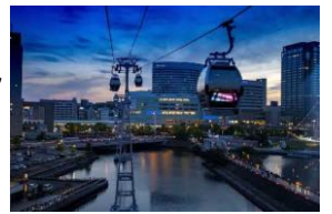
YOKOHAMA AIR CABIN

（EX旅先予約「みなとみらいを空から満喫！YOKOHAMA AIR CABIN+大観覧車」をご購入ください。）