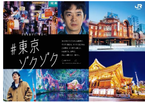
ポスター イメージ