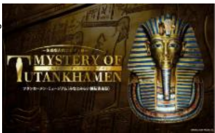
ミステリーオブツタンカーメン ～体感型古代エジプト展～

（EX旅先予約「EXサービス会員限定価格！MYSTERY OF TUTANKHAMEN／ミステリー・オブ・ツタンカーメン～体感型古代エジプト展～ 入館券」をご購入ください。）