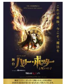
舞台『ハリー・ポッターと呪いの子』