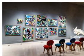
川崎市岡本太郎美術館

（EX旅先予約「JR東海×川崎市岡本太郎美術館コラボグッズ付入館券」をご購入ください。）