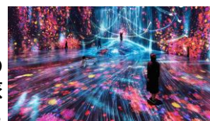
「森ビル デジタルアート ミュージアム：エプソン チームラボボーダレス」 麻布台ヒルズ、東京。チームラボ

（※）複数のアーティストや異なる分野の専門家が集まって形成される「アーティスト集団」のこと。 （EX旅先予約「森ビル デジタルアート ミュージアム：エプソン チームラボボーダレス チケット」をご購入ください。）