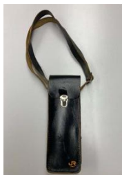
ブレーキハンドルケース