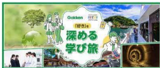
「好き」を深める学び旅 学研×クラブツーリズムロゴ