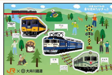
大井川鐵道：オリジナルステッカー