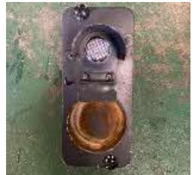
パイロットランプ

※詳細、出品内容、その他注意事項はオークション開始後のご案内を参照ください。また、3月20日（金・祝）17時00分～3月26日（木）23時59分までは武豊線ゆかりの鉄道用品等を出品しています。