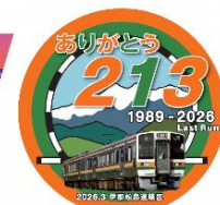
ヘッドマークデザイン