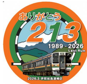
ヘッドマークデザイン（辰野方）