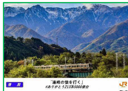
車内吊りポスターの例