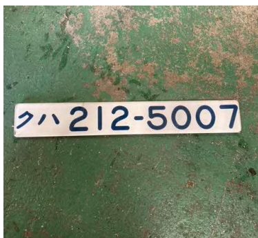
車両番号プレート