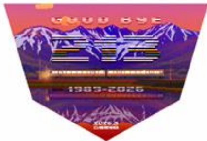
ヘッドマークデザイン（豊橋方）