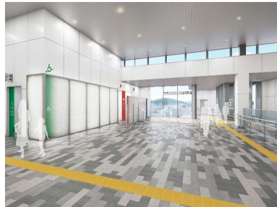
完成イメージ（上：自由通路南口、左下：改札外付近、右下：改札内付近）