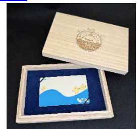
桐製の収納ボックス付き

桐製の収納ボックスは、日本国内の間伐材を積極的に活用するなどSDGsにも取り組む株式会社ゴーフォワードが制作したものです。職人が一つひとつ手作りで仕上げ、ぴよりん15周年のイラストをあしらいました。