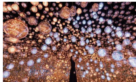
チームラボ《Bubble Universe: 光の球体結晶、ぷるんぷるんの光、環境が生む光 - ワンストローク》©チームラボ

最新のテクノロジーを駆使したインタラクティブな作品は、物理的な境界を超え、訪れる人々の存在や動きに影響を受けて変化します。色彩豊かで幻想的な景色が織りなす体験は、まるで夢の中にいるかのように。新しい感覚に出会えるミュージアムへ、ぜひ足を運んでみてください。