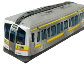
三岐線5000系 電車型ペンケース 税込 1,500 円