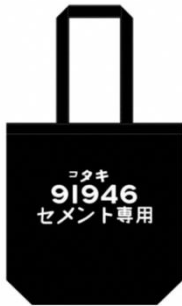
「タキ1900」 トートバッグ 税込 1,200 円