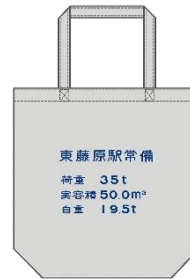
「ホキ1100」 トートバッグ 税込 1,200 円