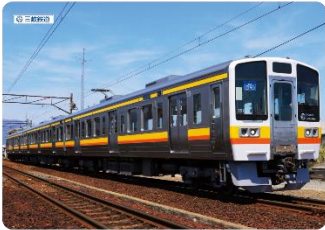
三岐線下じき （第4弾） 税込 400 円