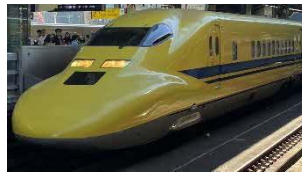
ドクターイエロー(T4編成7号車) ※日本車両が製造(2000年)