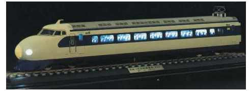
【参考】0系ディスプレイモデル(スケール1/45(Oゲージ)) ※カツミが製作し、日本車両が『日車夢工房』で販売(2001年)