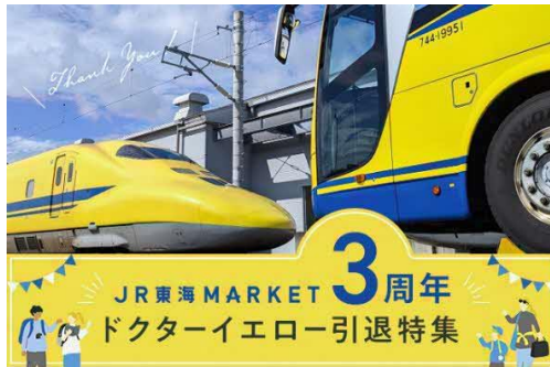
3周年メインビジュアル

駅やホテルの人気商品やオリジナル鉄道グッズ等を取り揃えた多彩なオンラインショップが集うECサイト「JR東海MARKET」が、2月7日に3周年を迎えました。3周年特設ページ内では、先月引退したJR東海所属の新幹線電気軌道総合試験車923形0番代(通称「ドクターイエロー」・以下「ドクターイエロー(T4編成)」)の引退特集を開催します。