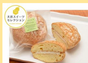
＜季節の洋菓子なつめ＞ フェイジョアブッセ