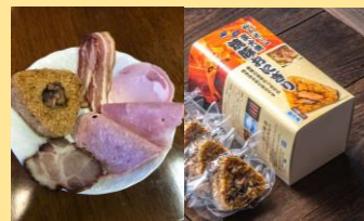
＜御殿場ハム石川商店＞ 焼豚おにぎりとハム