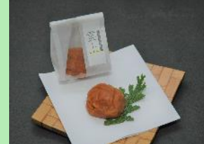
十郎梅プレミアム「雲上」 ※到着前にご提供

＜料金＞ おひとり 4,800円（税込）※ミネラルウォーター・お茶各1本が含まれます。