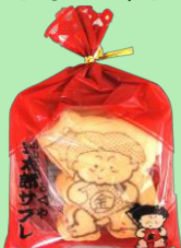
＜きくや＞ 金太郎サブレ