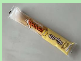
＜バンデロール＞ のっぽパン