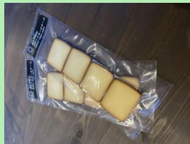
＜ミツマル燻製所＞ 手作リスモークチーズ