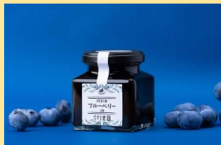
＜平野農園＞ ブルーベリージャム