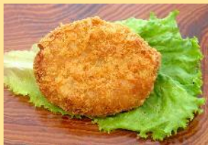
＜桃中軒＞ みしまコロッケ