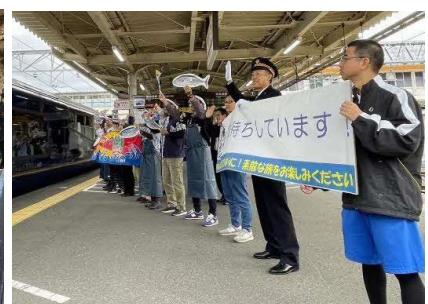
▲焼津市民皆さまのお出迎え