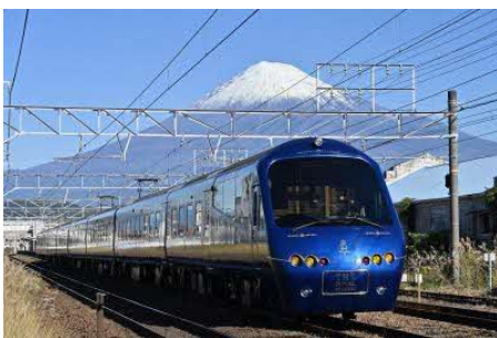
▲富士山のふもとを走行