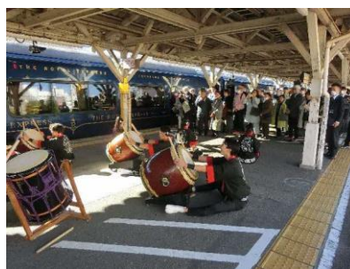
▲地元高校生による歓迎太鼓 【2024年運行の様子】